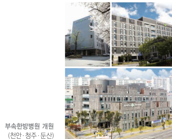
부속한방병원 개원 (전안·정주·둔산)