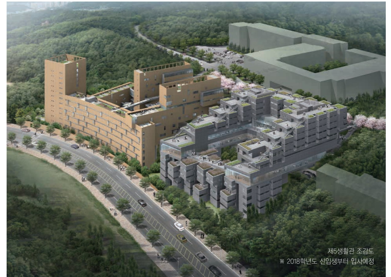
제5생활관 조감도 ※ 2018학년도 신입생부터 입사에정